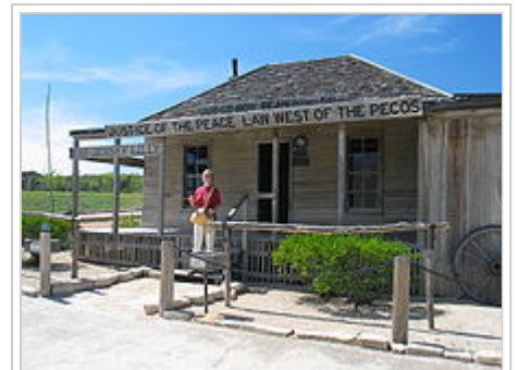
Saloon von Roy Bean