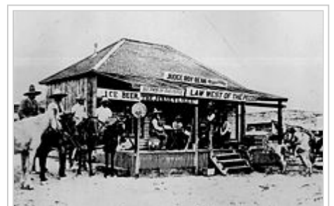
Saloon von Roy Bean um 1900