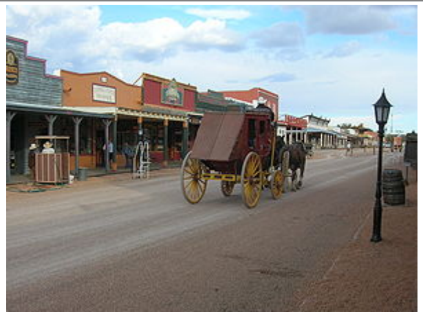
Allen Street in Tombstone