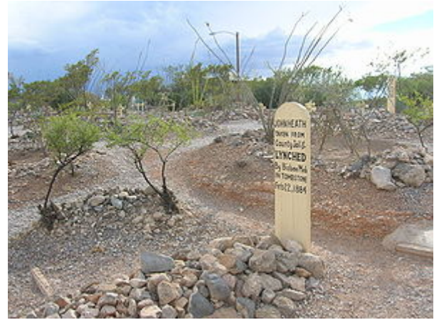
Gräber auf dem Boot Hill